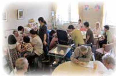
デイルームでは、ご家族も参加いただける様々なイベントを行っています。

デイルームでのんびりお茶を楽しめることも、ご家族が作った食事を一緒に食べていただくことも可能です。入院中でも、できるだけ普通の生活と変わらない生活を送って頂けるように四季の行事会や、誕生日会を開催しています。