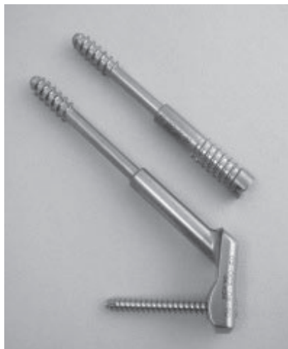
図1 Dual SC Screw (Kisco 社) スレッドバレル (上) とプレートバレル (下)