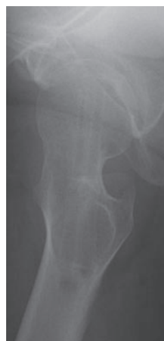
図 2-h 抜釘術後軸写像