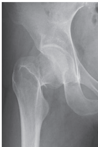
図 2-a 受傷時正面像

また, 4 例で移動能力の低下を認めたが, 認知症が強くリハビリテーションで協力が得られにくい症例であった。14 例は受傷前の ADL を維持していた。