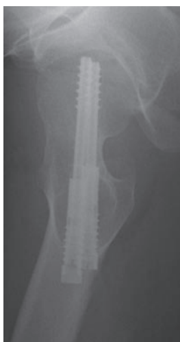
図 2-f 術後 2 年軸写像