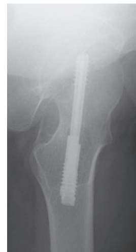
図3-f 術後半年軸写像