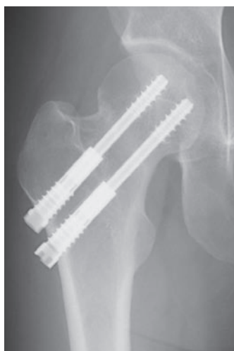
図 2-e 術後 2 年正面像