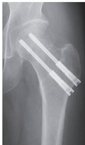
図3-e 術後半年正面像