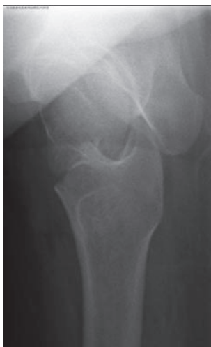
図 2-b 受傷時軸写像