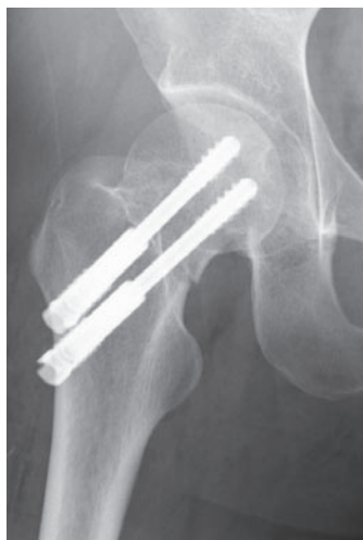
図 2-c 術直後正面像