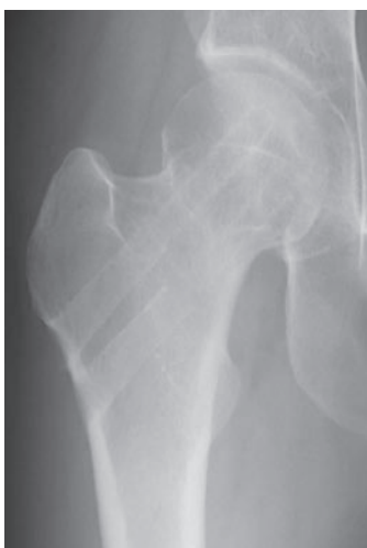
図 2-g 抜釘術後正面像