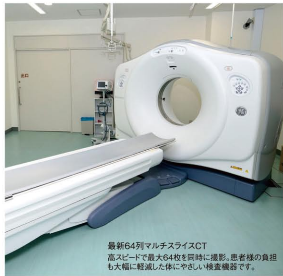
最新64列マルチスライスCT 高スピードで最大64枚を同時に撮影。患者様の負担も大幅に軽減した体にやさしい検査機器です。

瓦林 さらに循環器科専用のカテーテル室が設置されています。虚血性心疾患は、時間との戦いです。これは、心筋梗塞などの緊急治療を要する場合にカテーテル検査や治療がとてもスムーズに開始できる大きなメリットがあります。