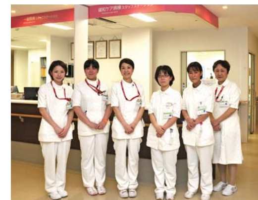
緩和ケア病棟のスタッフ