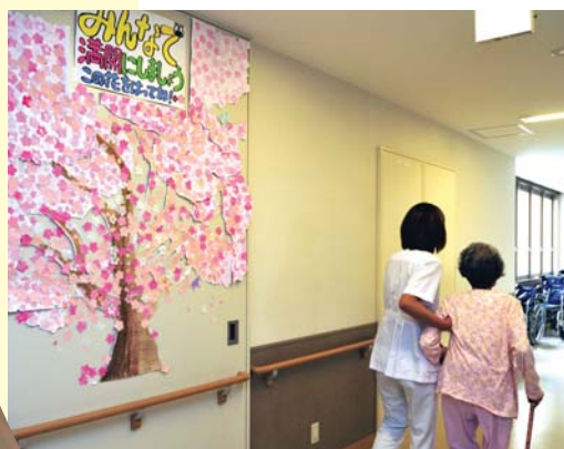
病棟内には季節に応じた工夫が

にしています。どんな些細なこともかまいません。患者様、ご家族の思いや願いをお聞かせください。