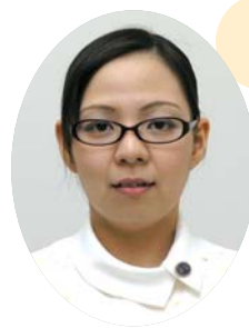
皮膚・排泄ケア認定看護師