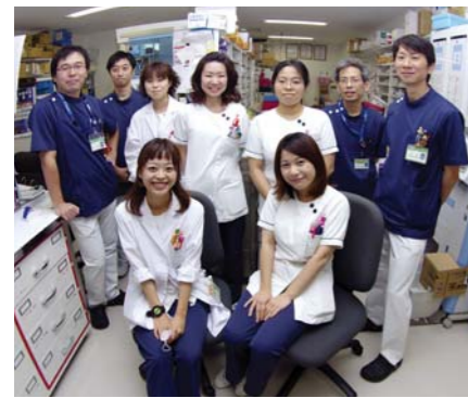
薬剤部のスタッフ

「おくすりは水またはぬるま湯で服用すること」とよく耳にしますがなぜでしょう？ これは、水以外の飲み物とくすりを一緒に飲んだ場合、くすりによっては飲み合わせによる相互作用が起こって、くすりの効果が強く出たり、弱まったり、あるいは副作用が発現しやすくなるなど影響があるからです。くすりと食べ物・くすり同士でも相互作用が起こることがあります。