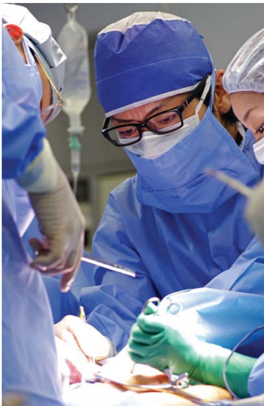
スピーディな治療が信条

可能な限りその日に診断ができるように泌尿器科での治療は、即時対応を求められることが多々あります。例えば尿管結石の場合、救急で来院された患者様に対し、当院の検査システムを活かし即日検査を行います。そして診断が確定なものとなり、可能であればその日に処置まで行います。こういったスピード感のある対応が、5年以内で約50%の再発率と言われているこの病気の患者様からの高評価を得、リピート率を高くしています。