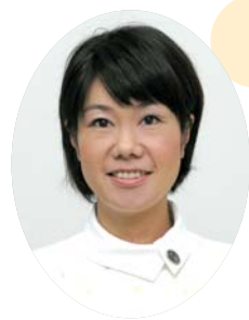
緩和ケア認定看護師