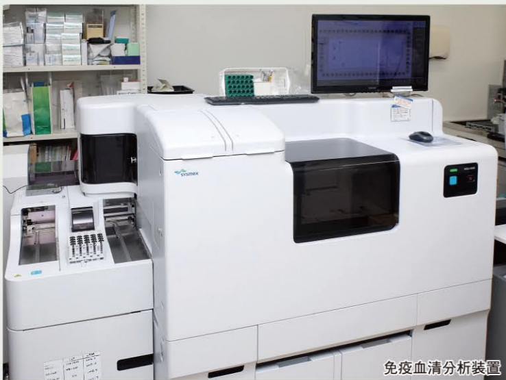
免疫血清分析装置