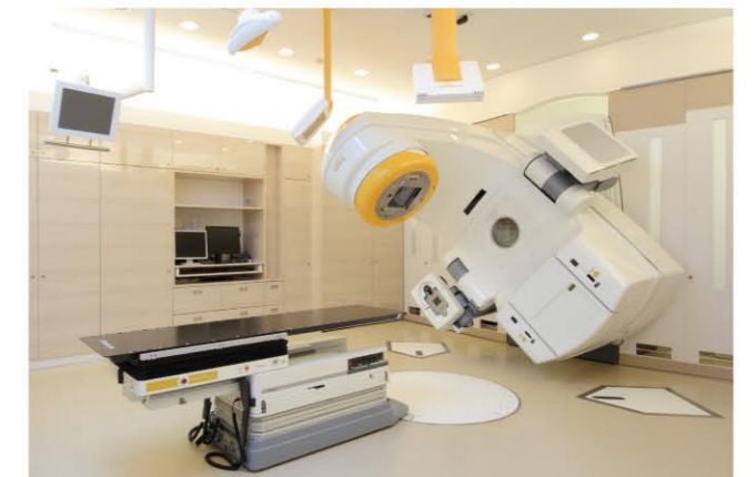
当院の高精度放射線治療装置「Novalis TX」