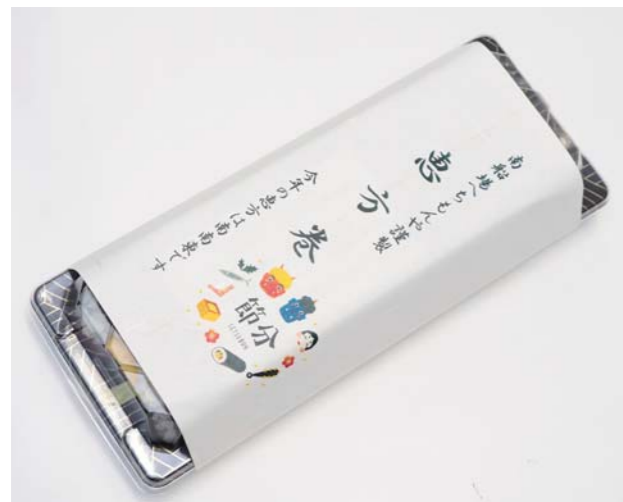
南船場 へちもんや様の恵方巻

当院へのご配慮に心より感謝申し上げます。ご寄贈いただいた恵方巻はスタッフ一同で美味しくいただきました。お心遣いを励みに、より良い医療の提供に努めてまいります。