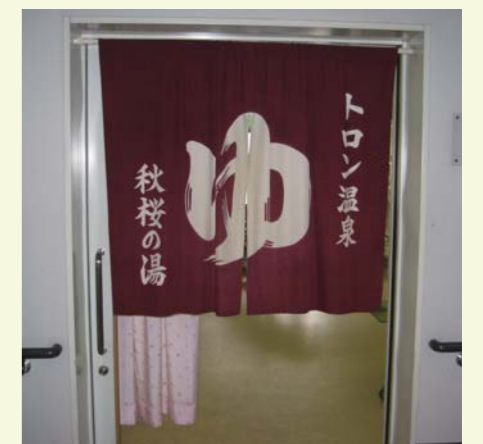
浴室の脱衣室には「ゆ」ののれんを掛け、気分だけでも温泉に来たようにしています。